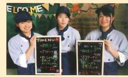
北海道倶知安農業高等学校