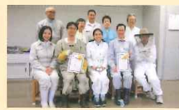
市立札幌大通高等学校